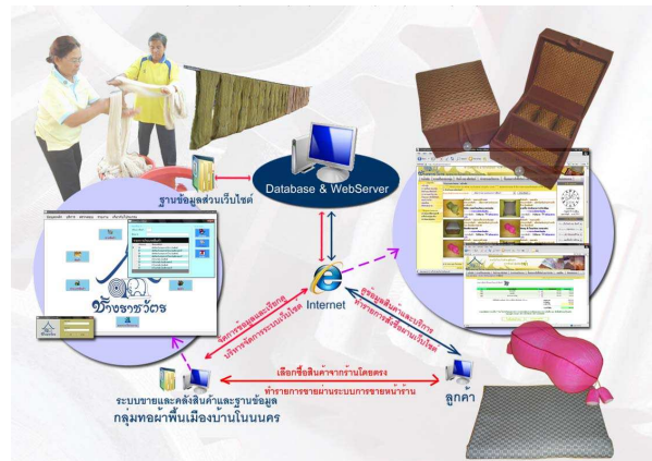
รูปที่ 1 โครงสร้างระบบเครือข่ายของระบบ

8.1 ระบบส่งเสริมการขายผ่านเว็บไซต์ ใช้ url http://rachawat.otopks.com ครอบคลุมทั้ง การเผยแพร่และประชาสัมพันธ์ข้อมูลสินค้า การส่งเสริมการขายโดยผู้ซื้อสั่งซื้อสินค้าผ่านเว็บไซต์ การค้นหาสินค้า และระบบผู้ดูแลระบบ ครอบคลุมการปรับปรุงข้อมูลระหว่าง ฐานข้อมูลหลัก และฐานข้อมูลบนเว็บไซต์ จัดการข้อมูลสินค้า ข่าว ตรวจสอบรายการสั่งซื้อ (เพิ่ม แก้ไข ลบ)